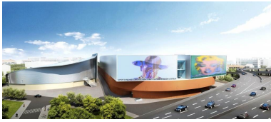
Le projet Bleu capelette, un des futurs centres commerciaux à l'entrée est de la ville.

Avant de lâcher : « Tous les terrains sont vendus à Marseille sans concurrence, donc il n'y a pas eu d'exception pour nous. »