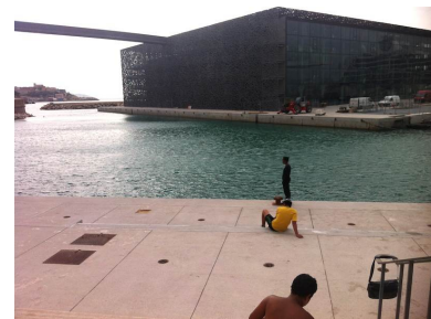
Derniers travaux du Mucem, au printemps 2013.